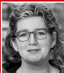
Charlotte Sahl-Madsen Minister Ministeriet for Videnskab, Teknologi og Udvikling